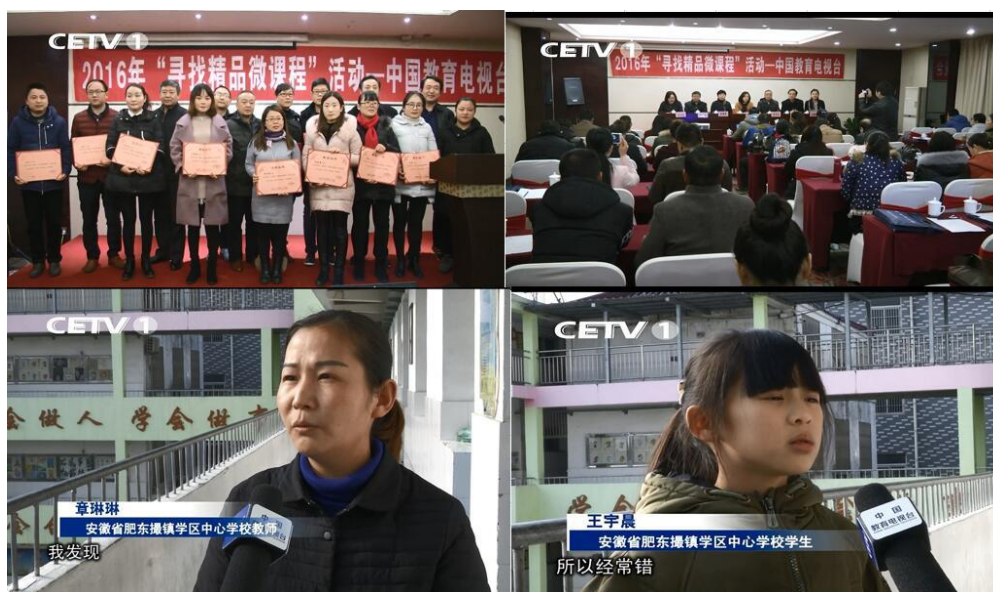
中国教育电视台专访 2015 年湖北国培

为推进新媒体、新技术的深入发展，推广优质课堂教学成果，创新教师培训模式，提高中小学教师信息化教学能力，加快学校信息化创新发展，中国教育电视台和安徽省相关教育主管单位于2016年9月-12月在安徽省范围开展了“寻找精品微课程”活动，广大教师积极参与本次活动，提交各类参赛作品上千件，经过专家组的初选和复选，共评选出精品微课作品68件，其中一等奖作品8件，二等奖作品13件，三等奖作品47件。