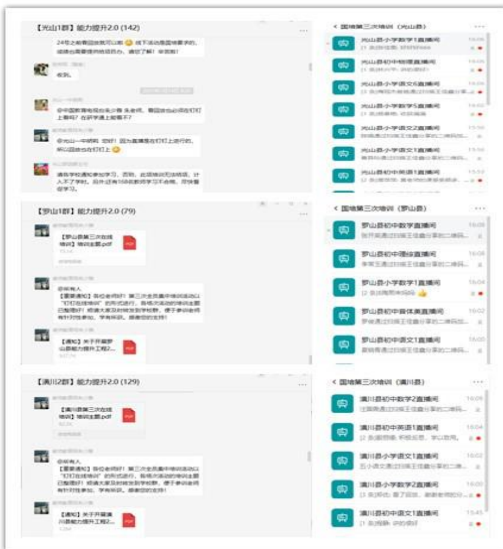
——项目组根据学科学段建立 60 个直播间——

我台特别组建了一支包含中原名师、省名师、省外特级教师，共计 26 人的学科专家团队，紧扣研修主题引领学员深度研修，保证研修内容和形式的实效性、针对性。