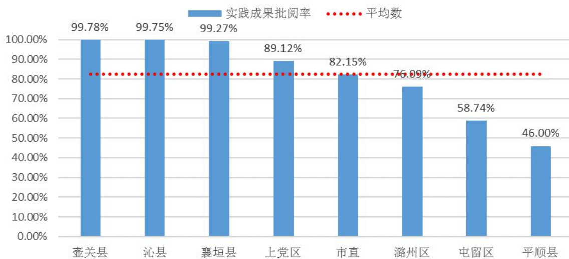
各县（市）辅导老师实践成果批阅率统计图（%）